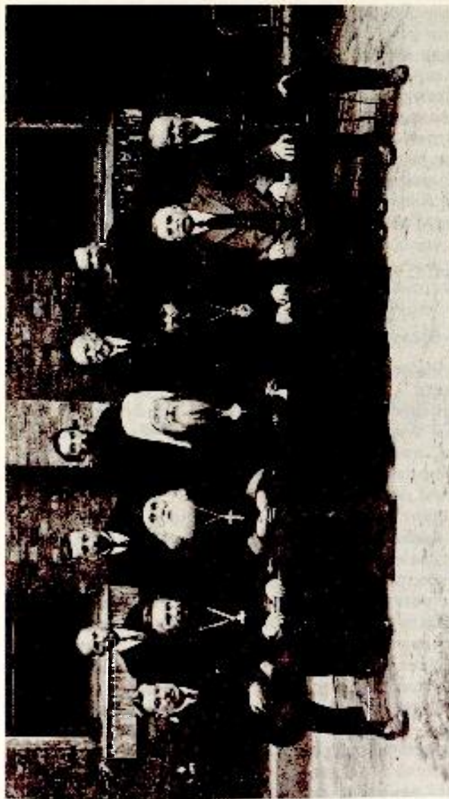
В Свято-Сергиевском Богословском Институте (1925).