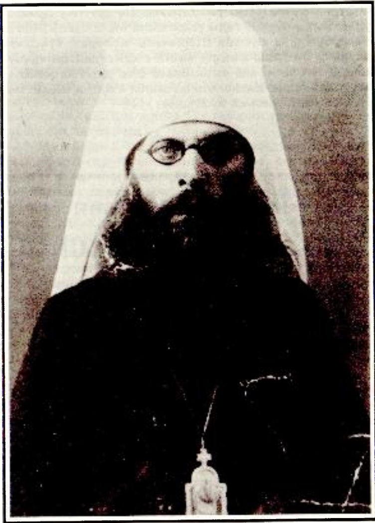
Митрополит Одесский Анатолий. 1935 г.