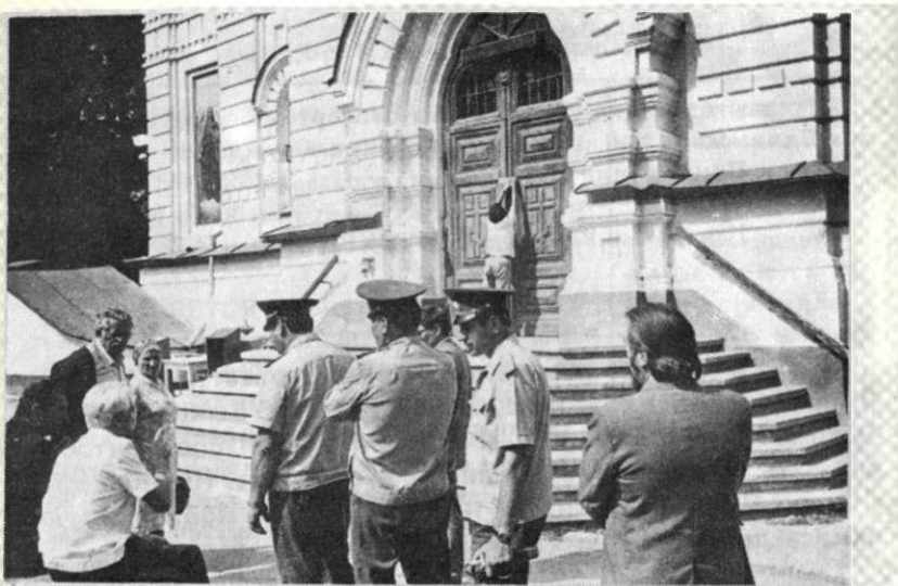
Ровно, 22.VIII.1992 г.