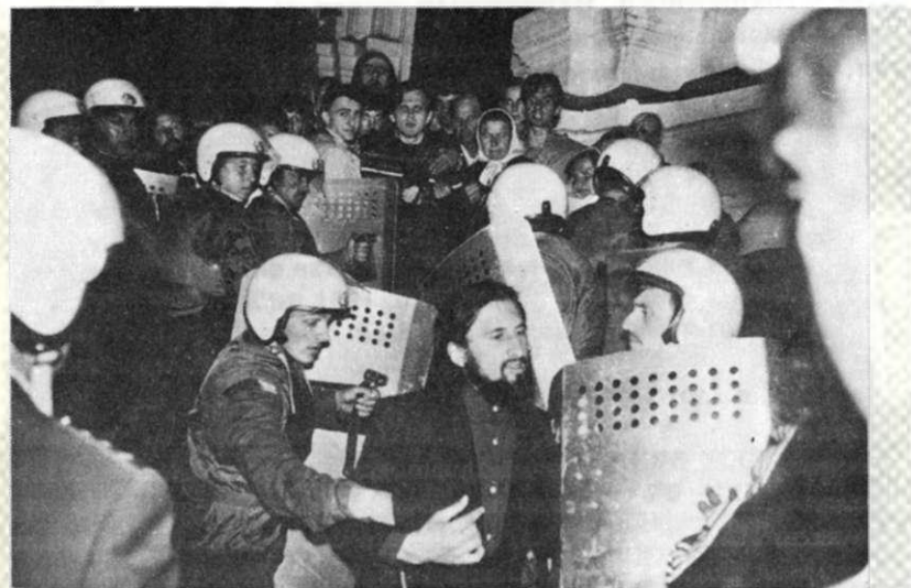
Ровно, 22.VIII.1992 г.