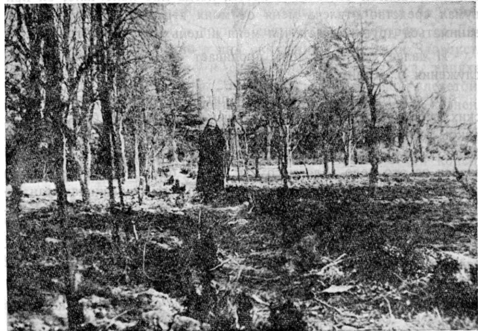
Мать Мария расчищает участок в Нуази-ле-Гран (весна, 1936 г.)