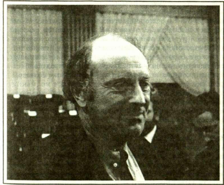
Иосиф Бродский. Стокгольм, 10 декабря 1987 г. За несколько часов до церемонии вручения Нобелевской премии.

«Deus conservat omnia» — эту латинскую надпись на фронте дома, где жила и умерла Ахматова, Иосиф Бродский, ее преемник, поставил своим девизом и заглавием стихотворного цикла. След во времени, иероглиф, знак, прихотливый жест Клио, китайская изощренность письма, которым запечатляется вечность на наших памятниках и в нас самих, — вот в чем величие поэта, вот