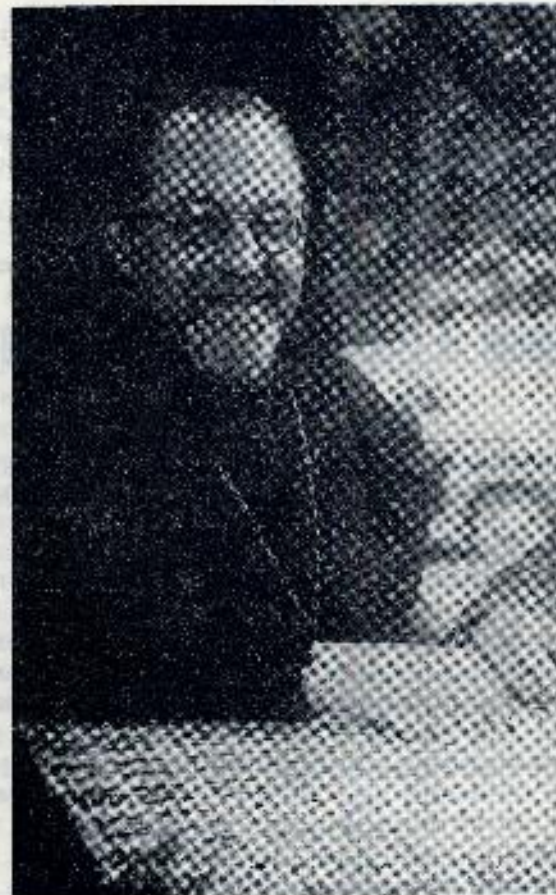
Протопресвитер Василий Зеньковский

Abonnement annuel: 10 F. Prix du N° 2,50 F. Rédaction: Action Chrétienne des Etudiants Russes, 91, rue Olivier de Serres, Paris-15°. France.