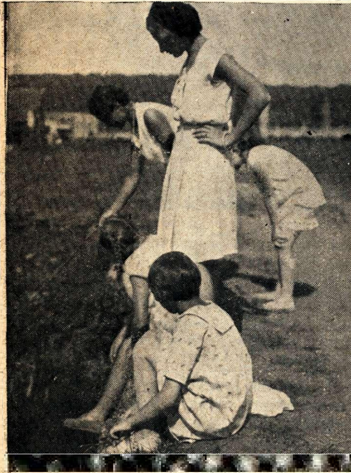
За рыбной ловлей.

творенія, но и цѣлыя сцены, которыя потомъ ставились во время вечернихъ «костровъ». Образовалась также группа, изучающая англійскій языкъ. Эта группа такъ же, какъ и всѣ другія, сплотилась настолько, что превратилась въ своего рода англійскій клубъ.