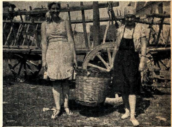
Дежурныя по кухнѣ.

давались почтовые марки, открытки, шоколадъ, фрукты, печенье и т. д. Въ лавочкѣ продавали сами дѣвочки, и дѣло сплеталось съ игрой. Съ 4 до 5 было свободное время, когда каждая занималась своимъ дѣломъ. Этимъ временемъ обыкновенно пользовались для устройства репетицій и спѣвокъ. За мѣсяць былъ разученъ цѣлый репертуаръ хоровыхъ русскихъ народныхъ и лагерныхъ пѣсень, исполнявшихся во время «костровъ» и пѣвшихся въ «походахъ». Въ 5 час. — чай, послѣ котораго былъ или спортъ (волейболль, баскетъ-болль, крокетъ, пингъ-понгъ) или купанье, если погода была жаркая, или прогулка, а то и все одновременно по группамъ.