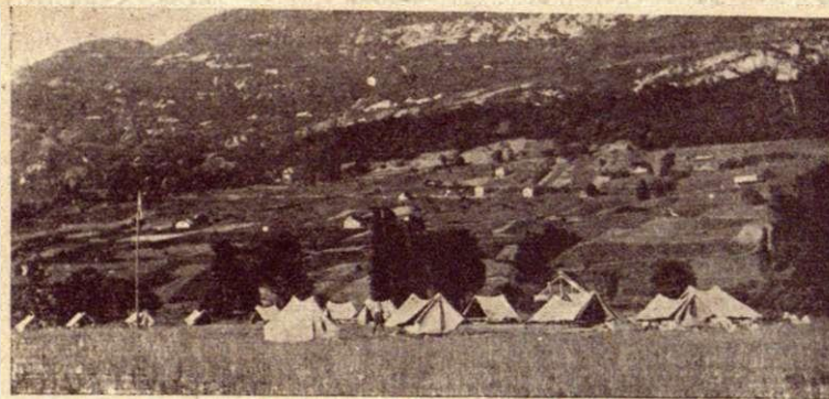
Общій видъ лагеря.