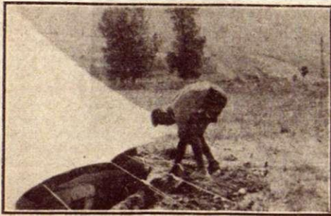
«Витязь» дѣлаетъ вокругъ палатки ровъ для стока дождевой воды.

не огорчаться, если результаты ее будут не совсем такими, как хотелось бы. Довѣрие должно быть положено в основу отношений его с мальчиками, он должен быть постоянным примѣром для них и поэтому ему слѣдует очень внимательно слѣдить за собой. Часто замѣчалось, что неоднократно повторяемые приказанія что-либо слѣдует оставались без послѣдствія до тѣх поръ, пока руководитель не бралъ мальчиковъ и не принимался самъ за работу.