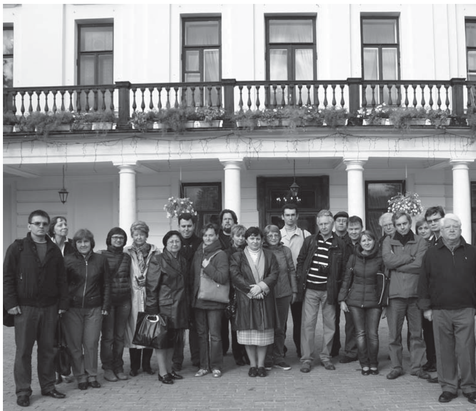
Участники конференции в усадьбе Средниково