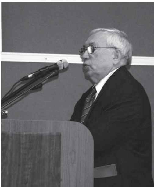
Уполномоченный по правам человека в Российской Федерации В.П. Лукин