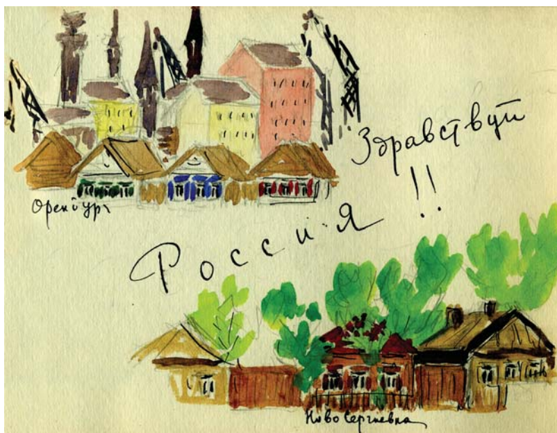
Здравствуй Россия! Оренбург. Ново-Сергиевка. Акварель из альбома-дневника Ю.Н. Рейтлингер (Л. 7)