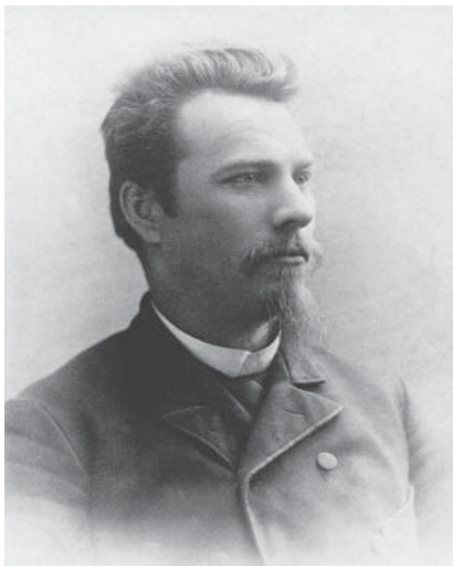
Е.Е. Лазарев в Америке, 1890 г.

для занятий физическим трудом, к которому был приучен с раннего детства. Лазарев был убежден, что нужно «торопиться жить, то есть мыслить, чувствовать, познавать себя и окружающий мир, напоминать людям, что человек из животного превращается в полубога только благодаря его жизни в обществе, что поэтому для полного человеческого счастья на земле долг каждого – любить ближнего своего, работать, творить...» [Там же, с. 74]. Много позже, в 1920-е гг., во время его пребывания в Чехословакии, российские эмигранты и чехи называли Егора Егоровича не иначе как «справедливый старик» [Андреев 1996, т. 2, с. 84].